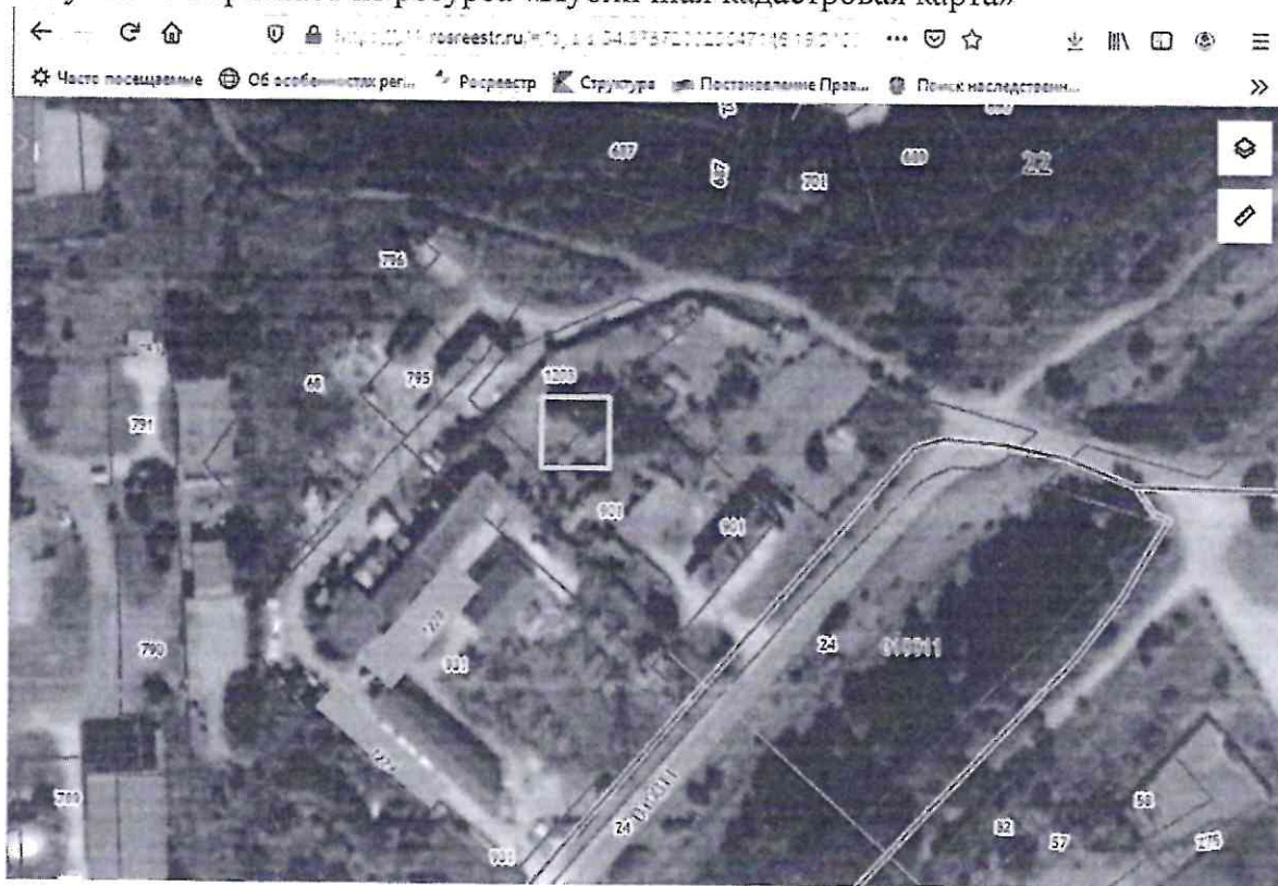
Рисунок 1. Скриншот из ресурса «Публичная кадастровая карта»

- Условное обозначение границ объекта незавершенного строительства